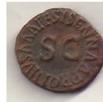
Bagside Quadrans (1/4 As) bronze mønt