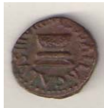
Forside „Guirlande smukket alter“