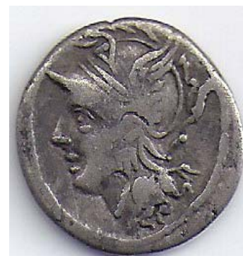
Forside Hjelmklædt hoved af Roma