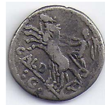
Bagside Victory i biga